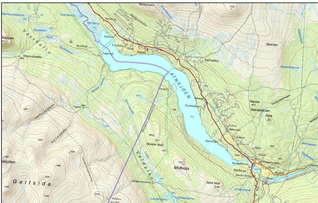
Figur 1: Områdekart

Atnsjøen ligger helt nord i Stor-Elvdal på grensen mot Follidal og Sør-Fron. Deler av den 4,8 km 2 store sjøen er en del av Setning og Atnedalen statsallmenning og er her den største sjøen. Atnsjøen har til alle tider hatt et rikt fiske av både ørret og røye. Fjell-lovens §28 gir alle norske statsborgere rett til fiske på statsallmenning og Atnsjøen er dermed viktig for både innenbygdsboende og allmenheten ellers. Den eneste adkomsten til sjøen er i dag via private rettighetshavere på nordsiden. Sollia fjellstyre, som etter fjell-loven, skal forvalte bruksretter som fiske på statsallmenningen kan i dag ikke tilby sine brukere adkomst til Atnsjøen (se kart under).